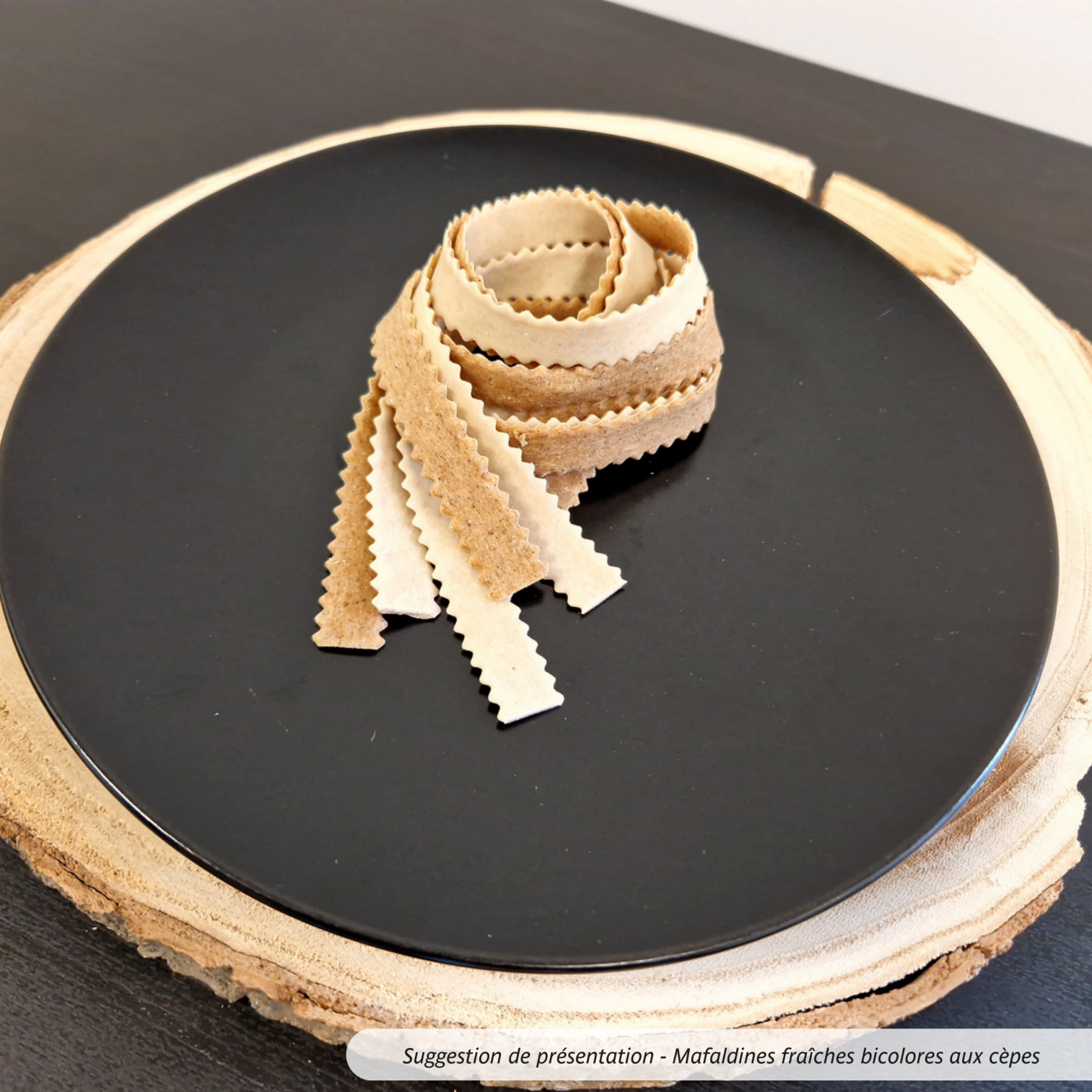
Suggestion de présentation - Mafaldines fraîches bicolores aux cèpes