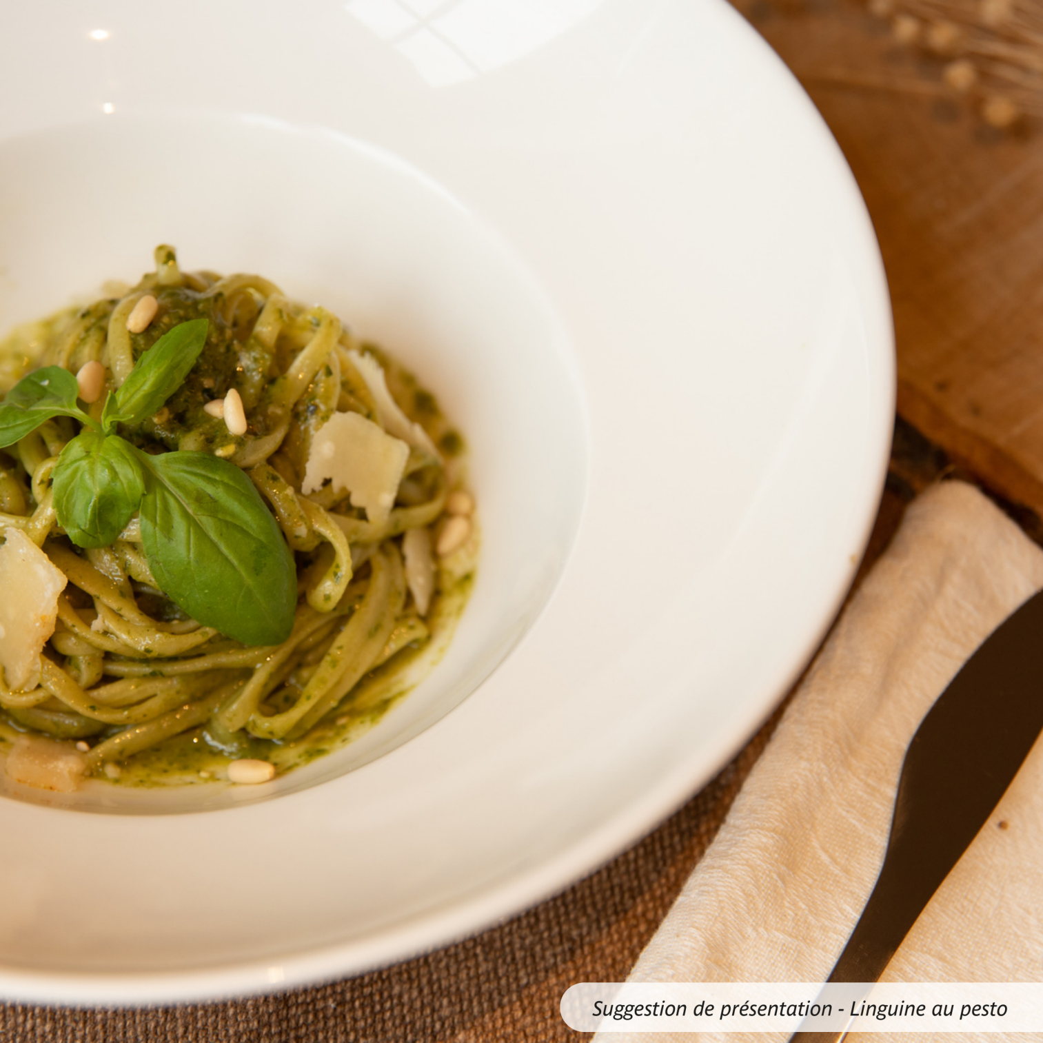
Suggestion de présentation - Linguine au pesto