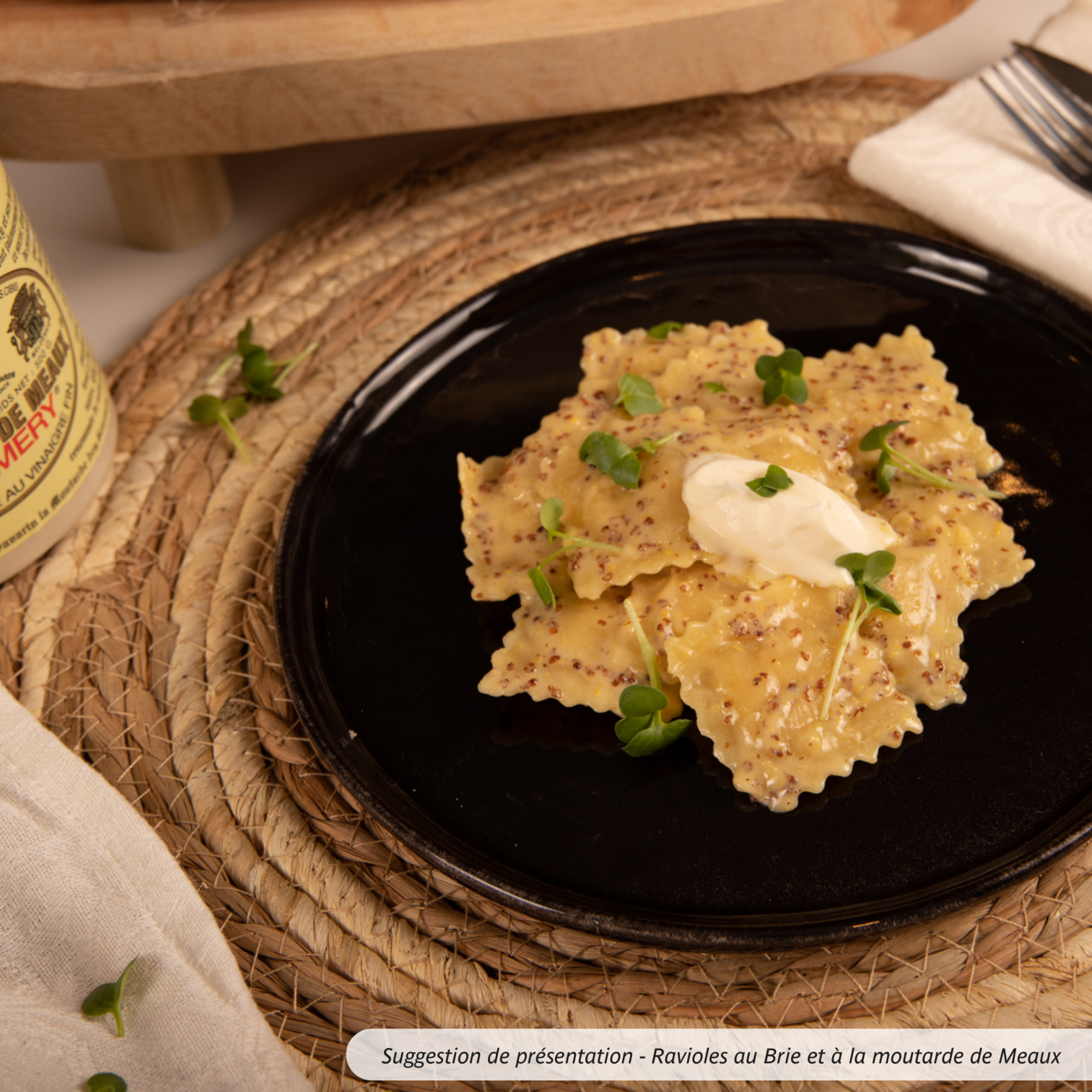
Suggestion de présentation - Ravioles au Brie et à la moutarde de Meaux